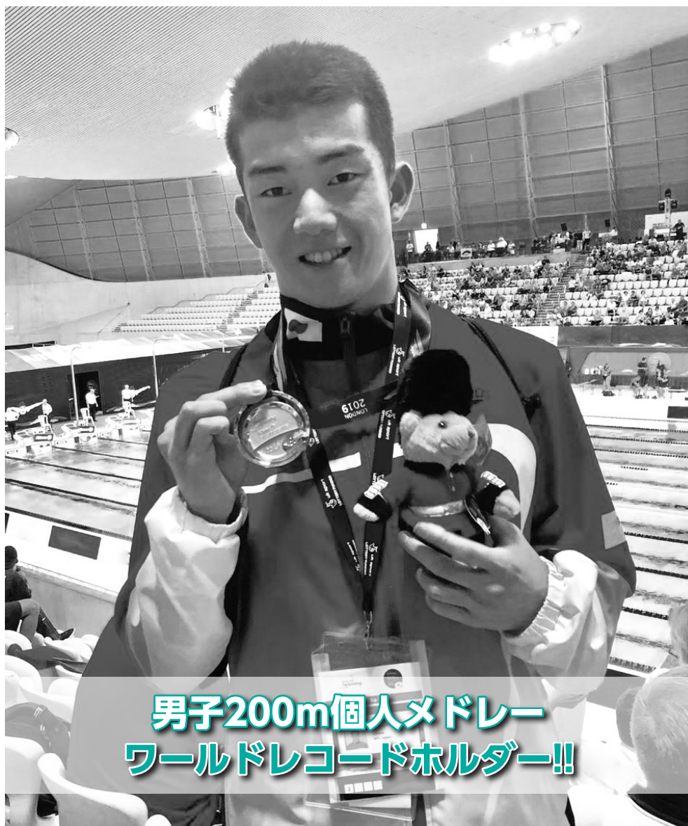
男子200m個人メドレー ワールドレコードホルダー!!