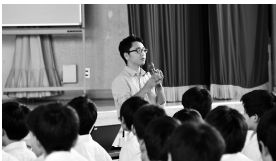
▲昨年の講演会の様子

今後も、他自治体との連携を一層深めながら、子どもから大人まで戦争と核兵器の廃絶について考える機会を設けていきます。