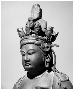
ほうしゃくいん 宝積院の十一面観音立像

山形市内には各地区に寺院があり、数多くの仏像がありますが、その中でも国が重要文化財に指定している仏像はわずかに4体です。山寺・立石寺に伝わる2体と、出羽地区の吉祥院、そして金井地区鮎洗の宝積院に1体ずつ鎮座しています。