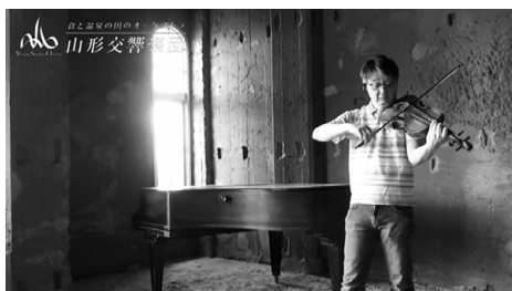
▲第2回配信「謎の建物」編