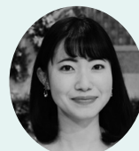
菅原智都アナウンサー