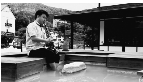
▲第4回配信「足湯でゆったり」編

この企画は、山形交響楽団員が、山形市内の名所や山形らしい場所、知る人ぞ知る穴場などさまざまなところで「花笠音頭」の演奏をリレーして山形の魅力を発信する動画です。演奏に加えて楽団員の方のインタビューもあり、山形の魅力を再確認するとともに、山形交響楽団がより身近に感じられる内容となっています。 皆さん、ぜひご覧ください！