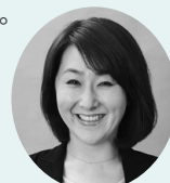
松下香織アナウンサー