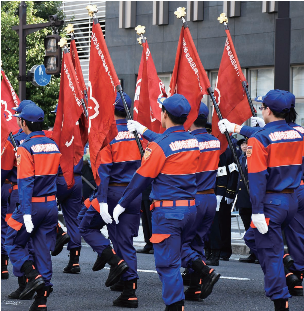
大切な人、大切なまちのために