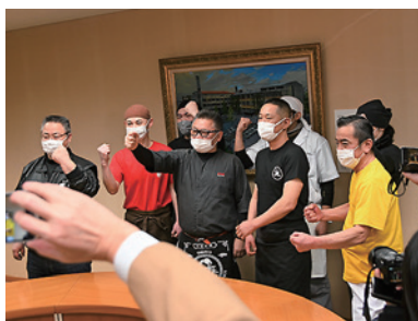
▲結果に歓喜するラーメン店の店主たち