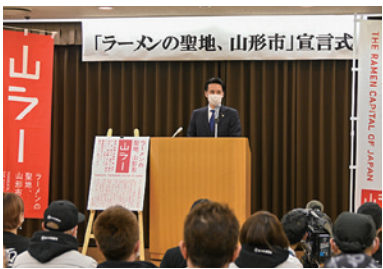
▲「ラーメンの聖地、山形市」宣言式

ラーメン好きならぜひとも食べに来たい町を目指して、これからもラーメンによる町おこしを推進していきます。