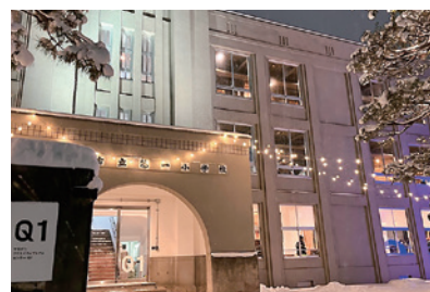
▲やまがたクリエイティブセンターQ1