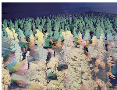
▲樹氷ライトアップ