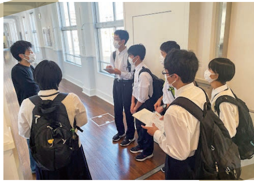
▲やまがたクリエイティブシティセンター Q1 を取材

お店の良さを引き出せるようなインタビューをみんなが厳選し、じっくり時間をかけて取材しています。私たちの思いが詰まった内容になっています。ぜひ記事にも目を通してみてください。