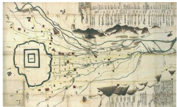
▲山形五堰の古地図