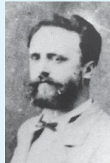
▲ローレツ博士