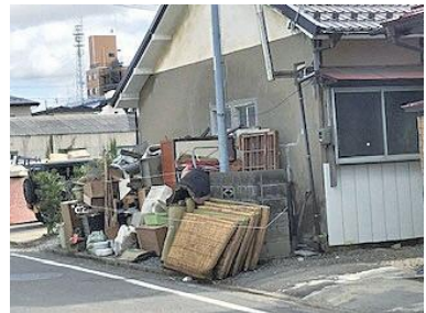
▲令和元年東日本台風による片付けごみの排出状況(福島県郡山市)