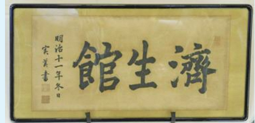
▲三条実美揮毫（郷土館所蔵）