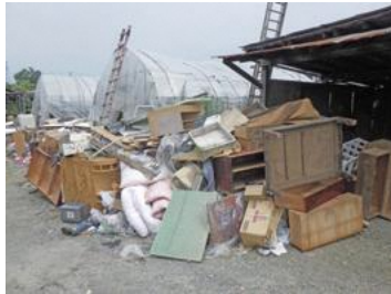
▲令和2年7月豪雨による片付けごみの発生状況(山形市)