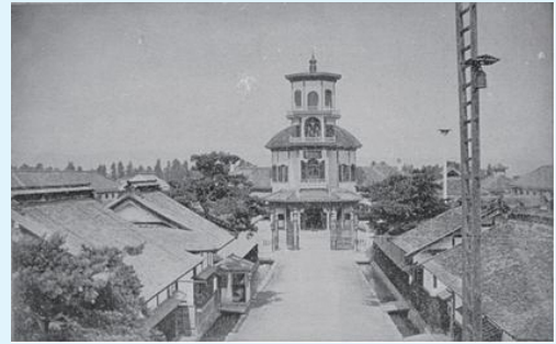
▲旧済生館（郷土館所蔵）